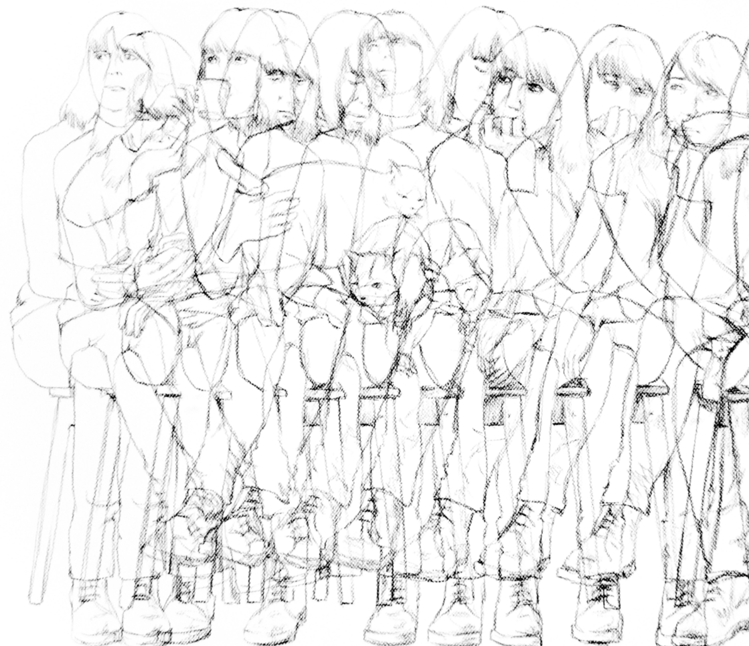
Imagen: 33 (Serie "Punto muerto"), 2014. Lápiz carbón / Papel Canson. Diseño: www.2x1agencia.com D.L.: AS-03359-2013