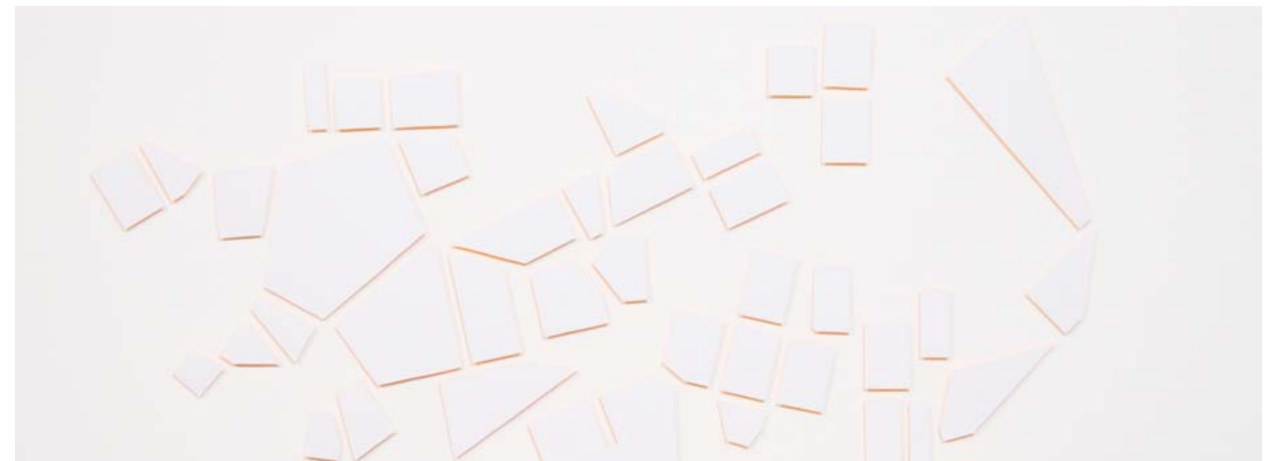
→ Forastero (Serie Mapas sugeridos ), 2014. Cartulina recortada. 30 x 80 cm.

en la Sala Borrón de Oviedo coincide con otra individual en la Antigua Pescadería de Avilés, dentro del Festival "Miradas de Mujeres".