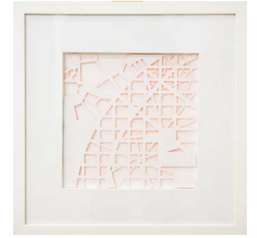
→ Ensanche (Serie Mapas sugeridos ), 2013. Cartulina recortada. 30 x 30 cm