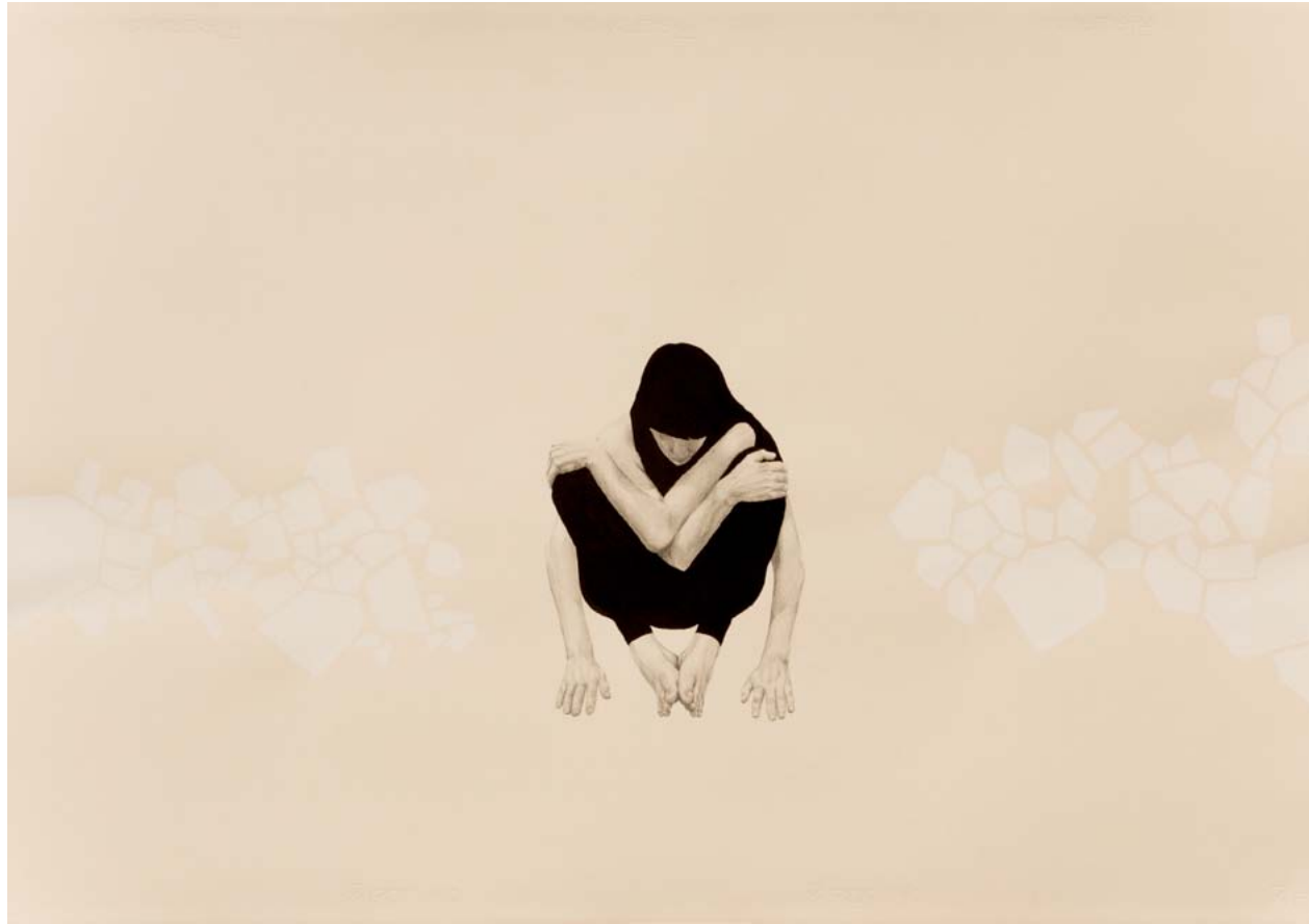
→ Slt (Serie Los mapas que habito ), 2011. Lápiz y tinta china / papel. 70 x 100 cm.